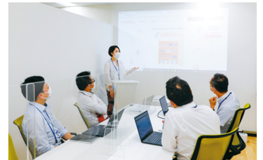
本社オフィスには複数の会議室を完備し、お客様との商談や社員同士のミーティングなども行っています。誰もが気さくに話せる明るい社風です。

IT分野は今後、あらゆる産業において不可欠なものであり、そのスキルを身につけることは大きな武器となります。弊社では文系・理系出身問わず門戸を開き、豊かな未来を支援します。